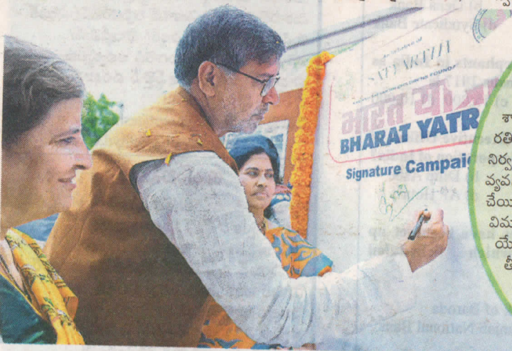
రవీంద్రభారతిలో జరిగిన కార్యక్రమంలో సంతకం చేసిన కైలాష్ సత్యార్థి

కైలాష్ సత్యార్థి బాలలతో కలిసి బతుకమ్మ ఆడారు. పిల్లల్ని పరిచయం చేసుకుని వారితో మాట్లాడారు. అంత కుముందు 'బాలలను రక్షిద్దాం' అంటూ బాలలు చేసిన ప్రదర్శన ఆలోచింపజేసింది. ఈ సందర్భంగా కైలాష్ సత్యార్థితో ఫోటో దిగేందుకు పలువురు ఆసక్తి కరబరచారు.