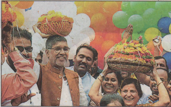
Nobel laureate Kailash Satyarthi joins in Bathukamma festivities at a function to mark Bharat Yatra in the city on Thursday

The yatra, launched in Kanyakumari on September 11, is part of the 'Surakshit Bachpan-Surakshit Bharat' campaign aimed at protesting against child rape and sexual abuse. Speaking about the three-year campaign, Satyarthi stressed the importance of increasing awareness about reporting of cases of child sexu-