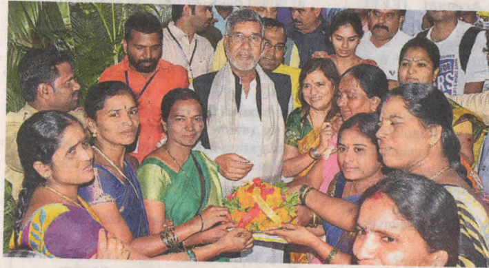
కైలాష్ సత్యార్థికి బతుకమ్మతో స్వాగతం పలుకుతున్న మహిళలు

అక్షరగంజ్: నవభారత నిర్మాణానికి సమాజంలోని ప్రతి ఒక్కరూ కృషి చేయాలని నోబెల్ పురస్కార గ్రహీత కైలాష్ సత్యార్థి పేర్కొన్నారు. భారతీయాత్ర గురువారం నాంపల్లి ఎగ్జిబిషన్ మైదానానికి చేరుకుంది. ఈ సందర్భంగా ఏర్పాటు చేసిన బహిరంగ సభలో ముఖ్య అతిథిగా పాల్గొన్నారు. పిల్లలపై లైంగిక దాడులు, అక్రమ రవాణా, వెట్టి చాకిరి ఆగే వరకు తన పోరాటం కొనసాగుతుందని ఆయన పేర్కొన్నారు. దేశంలో పిల్లలకు రక్షణ ఉన్నప్పుడే అన్ని రంగాల్లో సురక్షితంగా ఉంటుందన్నారు. నగరానికి చెందిన ఇద్దరు బాలికలు వ్యభిచార గృహాలకు బలవంతంగా తరలించబడి, అక్కడి నుంచి తప్పించుకోవడమే కాకుండా వందలాది మంది బాధితులను కాపాడడం అభి నందనీయమన్నారు. హింసకు గురయ్యే చిన్నారులంతా తన బిడ్డలేనని, వారి కోసం నిరంతరం పోరాటం కొనసాగు తుందన్నారు. చిన్నారులను అక్రమ రవాణా చేసే వారు, కొనే వారి ఆటలు ఇక సాగవని అన్నారు. హింసకు గురయ్యే బాలికలకు తాను అండగా ఉంటానని, ప్రభుత్వం పూర్తి మద్దతు ఇస్తుందన్నారు. బాలుర హింసపై ప్రభుత్వాలు కఠినంగా వ్యవహరించడంపై సంతోషం వ్యక్తం చేశారు. బాలల భద్రతపై హైదరాబాద్ లో వెలుగుతున్న కాగడాల వెలుగులు, పిల్లల నోటి నుంచి వస్తున్న నినాదాలు భారతదేశంతో పాటు యావత్ ప్రపంచానికి చాటి చెప్పేందుకు కృషి చేస్తానన్నారు. అనంతరం సభలో పాల్గొన్న వారితో ప్రమాణం చేయించారు. ఎంపీలు కేకేశవ రావు, వినోద్, కొండా విశ్వేశ్వర్ రెడ్డి మాట్లాడుతూ బాలల భద్రత కోసం నిర్వహిస్తున్న భారతీయాత్ర అభినందనీయ