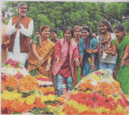
బతుకమ్మ ఆడుతున్న కైలాష్ సత్యార్థి

రవీంద్రభారతి: బాల్యాన్ని కాపాడుకుంటే.. భారత జాతిని సంరక్షించుకున్నట్లే అని నోబెల్ పురస్కార గ్రహీత కైలాష్ సత్యార్థి అన్నారు. భారత్ యాత్రలో భాగంగా గురువారం రవీంద్రభారతిలో కైలాష్ సత్యార్థికి ఆత్మీయ సత్కార సభ నిర్వహించారు. ఎన్సీసీ క్యాడెట్లు కవాతు చేయగా పిల్లలు ఆటా.. పాటలతో స్వాగతం పలికారు. అమ్మాయిలు బతుకమ్మలు ఆడుతుంటే.. కైలాష్ సత్యార్థి అడుగులు వేసి పిల్లలను ఉత్సాహపరిచారు. సభలో