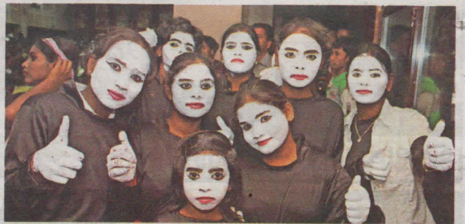
సుందరయ్య కళా నిలయంలో విద్యార్థినుల సందడి