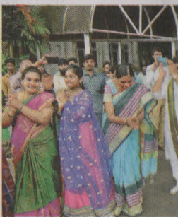
గురువారం హైదరాబాద్ బతుకమ్మ వేడుకలో మహిళలు ఆడుతున్న మ

బతుకమ్మ సంబురల్లో భాగంగా తూల పురాతన పాఠశాల ప్రాంగణంలో దోభూల మధ్య పువ్వు ఆకారం కెమెరాతో బంధించగా ఇలా ఆ