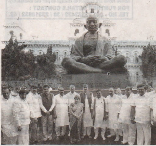
గురువారం అసెంబ్లీని సందర్శించి ఆవరణలోని గాంధీ విగ్రహం వద్ద స్వీకర్, మంత్రులతో గ్రూప్ ఫోటో దిగిన నోబెల్ బహుమతి గ్రహీత కైలాస్ సత్యాగ్రహి