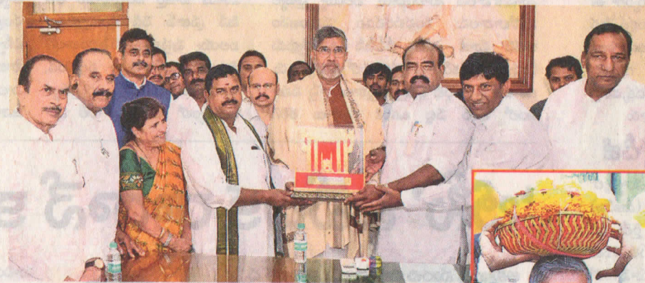
సత్యార్థికి జ్ఞాపికను అందజేస్తున్న స్పీకర్ మధుసూదనాచారి, మండలి చైర్మన్ స్వామిగౌడ్, డిప్యూటీ సీఎం మహమూద్ అలీ, హోంమంత్రి నాయిని, ఎంపీ వివోద్

హైదరాబాద్ నీటి, హైదరాబాద్, అఫ్లీగంజ్, చిక్కడ పల్లి, నాంపల్లి, సెప్టెంబరు 21 (ఆంధ్రజ్యోతి): “అరబ్ షేక్లు అక్రమ మానవ రవాణాదారులు. బాలికలను లైంగిక బానిసలుగా మార్చుతున్న భూతాలు. మత విశ్వాసాల పేరిట మానవత్వం మంటగలిసేలా ఉన్న వారి దుశ్చర్యలు క్రమించరాని నేరం. అరబ్ షేక్లు స్టేప్ మాస్టర్స్ (బానిసలుగా మార్చే గురువులు). గొప్ప మతానికి సంబంధించిన విశ్వాసాలు, కట్టుబాట్లను విలాసాల కోసం వారు ఉల్లంఘిస్తున్నారు” అని నోబెల్ పురస్కార గ్రహీత కైలాష్ సత్యార్థి ఆగ్రహం వ్యక్తం చేశారు. వారి పట్ల కఠినంగా వ్యవహరించాలని, ఆ షేక్ల కోసం పని చేసే ఐరోపా గ్యాంగ్ల ఆట కట్టించాలన్నాడు. భారత్