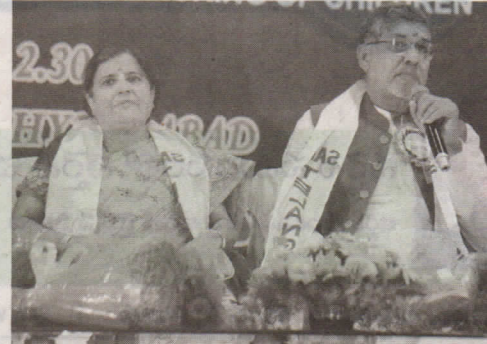
రవీంద్ర భారతిలో నిర్వహించిన కార్యక్రమంలో ప్రసంగిస్తున్న కైలాస్ సత్యాగ్రహి

కైలాస్ సత్యాగ్రహి చేపట్టిన భారత్ యాత్రకు మద్దతుగా గురువారం మోజం జూపీ మార్కెట్ నుండి ఎగ్జిబిషన్ గ్రౌండ్స్ వరకు ప్రదర్శన జరిగింది. ఈ కార్యక్రమంలో పార్లమెంట్ సభ్యులు