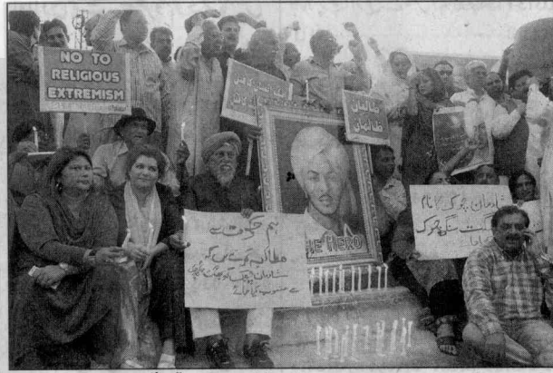
سول سوسائٹی کے ارکان شادمان چوک میں بھگت سنگھ کی برسی کے موقع پر شمعیں روشن کئے ہوئے