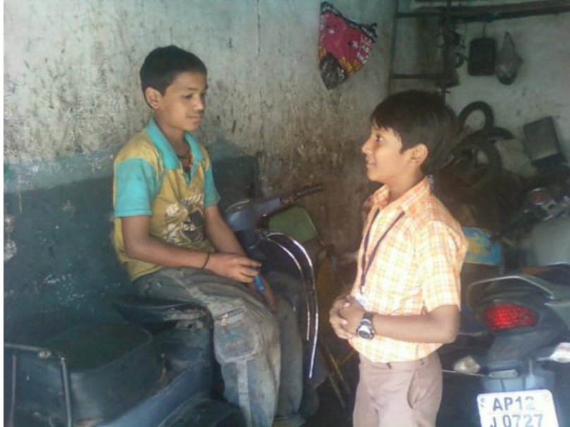
Special moments: Talking to a child working in a garage.