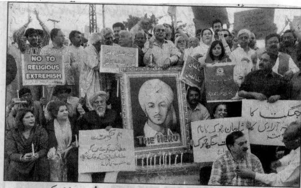
لاہور: بھگت سنگھ کی برسی کے موقع پر سوسائٹی کے ارکان نے شمعیں روشن کر رکھی ہیں

بھگت سنگھ کی برسی کی تقریب لاہور (نمائندہ جنگ) بھگت سنگھ فاؤنڈیشن و سوسائٹی سے تعلق رکھنے والی دیگر تنظیموں نے جنگ آزادی کے ہیرو بھگت سنگھ کی 84 ویں برسی کی تقریب کا انعقاد کیا۔ اس موقع پر بھگت سنگھ فاؤنڈیشن کے صدر عبداللہ انساؤں کے لئے کی جانے والی جدوجہد کو خراج تحسین پیش کیا۔ اس موقع پر بھگت سنگھ فاؤنڈیشن کے صدر عبداللہ صفحہ 4 بتیہ نمبر 11