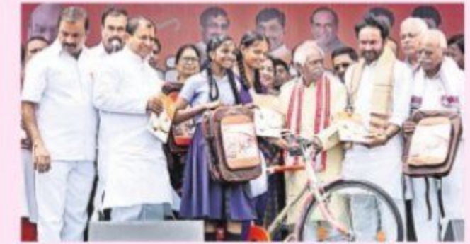
విద్యార్థులకు సైకిళ్ళను అందజేస్తున్న దత్తాత్రేయ