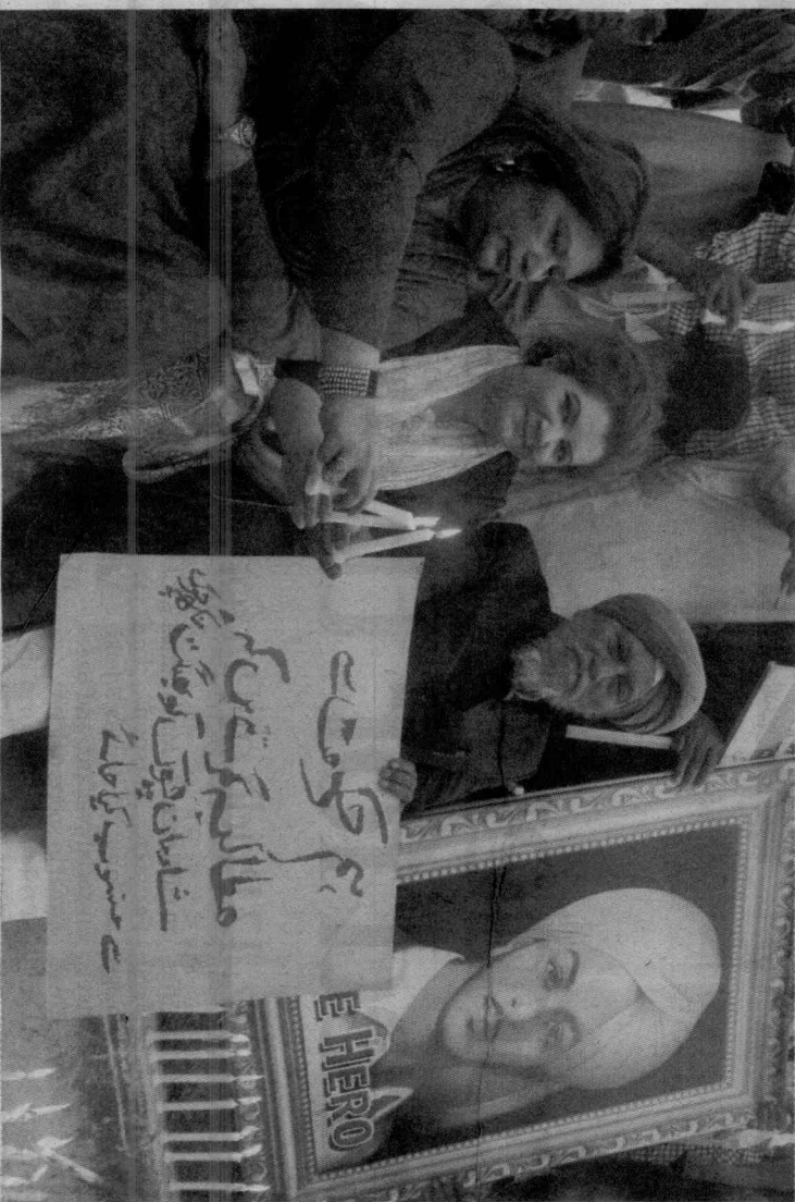
REMEMBERING A HERO: participants lighting candles at the vigil.

They said that the government had earlier tried to rename the place.