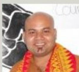
Citizen Journalist and activist.