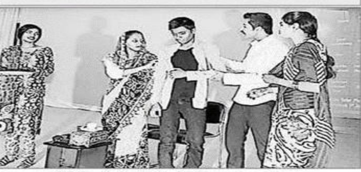
నాటికను ప్రదర్శిస్తున్న పాఠశాల విద్యార్థులు