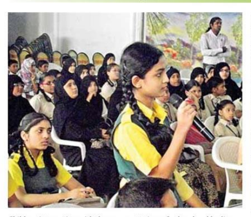
Children interacting with the representatives of urban local bodies

Children interact with officials in a 'Face-To-Face' programme