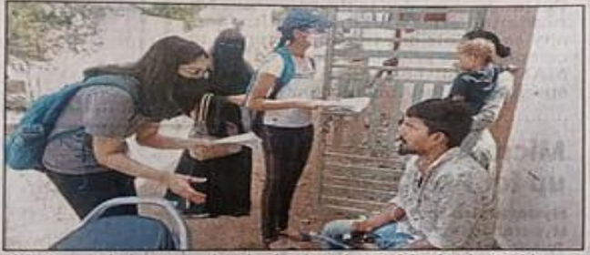
Birla Open Minds International school students visited Indra Reddy Nagar, Shankarpalle as part of an internship

"Our study clearly showed that there are serious problems regarding water supply, drainage, roads, and employ-