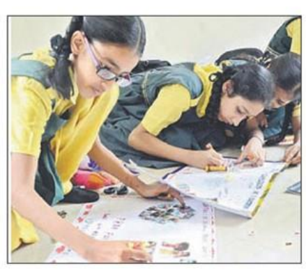
చిత్రలేఖన పోటీల్లో బాలబావికలు